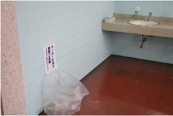
◆消毒液・ペーパータオル・石鹸の設置